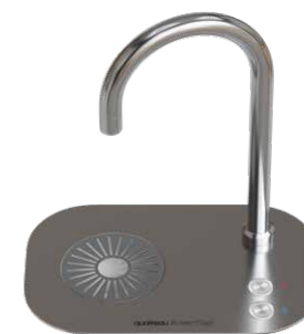
2-3 BOUTONS AVEC BAC D'ÉGOUTTOIR

Bac d'égouttement optionnel pour les modèles SmartTap